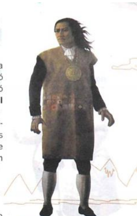
FIGURA 4. » Las reformas económicas generaron numerosas rebeliones, como la liderada por el cacique Túpac Amaru II.

Sin embargo, también tuvieron efectos negativos para España. Los criollos quedaron excluidos de la administración colonial. Esto generó conflictos, ya que exigían tener mayor participación en el gobierno. A su vez, los sectores medios y bajos rechazaban el aumento de los impuestos, lo que profundizó aún más los conflictos sociales .