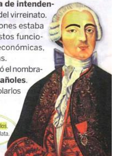
FIGURA 3. » Pedro Cevallos, primer virrey del Río de la Plata.

Finalmente, la Corona priorizó el nombramiento de funcionarios españoles . Consideraba que podría controlarlos mejor que a los criollos.