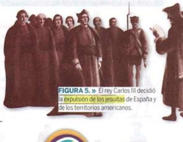
FIGURA 5. » El rey Carlos III decidió la expulsión de los jesuitas de España y de los territorios americanos.

❖ Luego de escuchar el audio y de leer los textos realiza las siguientes actividades.