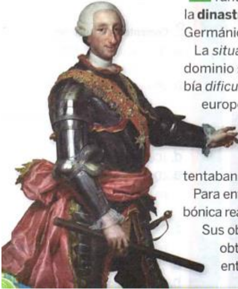
FIGURA 1. » El rey español Carlos III fue uno de los principales impulsores de las reformas borbónicas.

En 1700, el rey de España, Carlos II, murió sin dejar herederos. Se produjo, entonces, la guerra de Sucesión entre los diferentes aspirantes al trono: la dinastía de Borbón , que gobernaba en Francia, y la dinastía de Habsburgo , que gobernaba en el Sacro Imperio Romano Germánico. Finalmente, en 1713 se impuso la casa de Borbón.